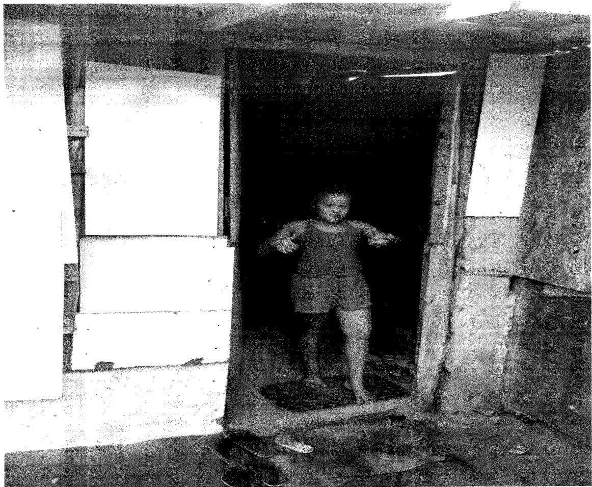
VISITA DOMICILIAR E COMUNITÁRIA