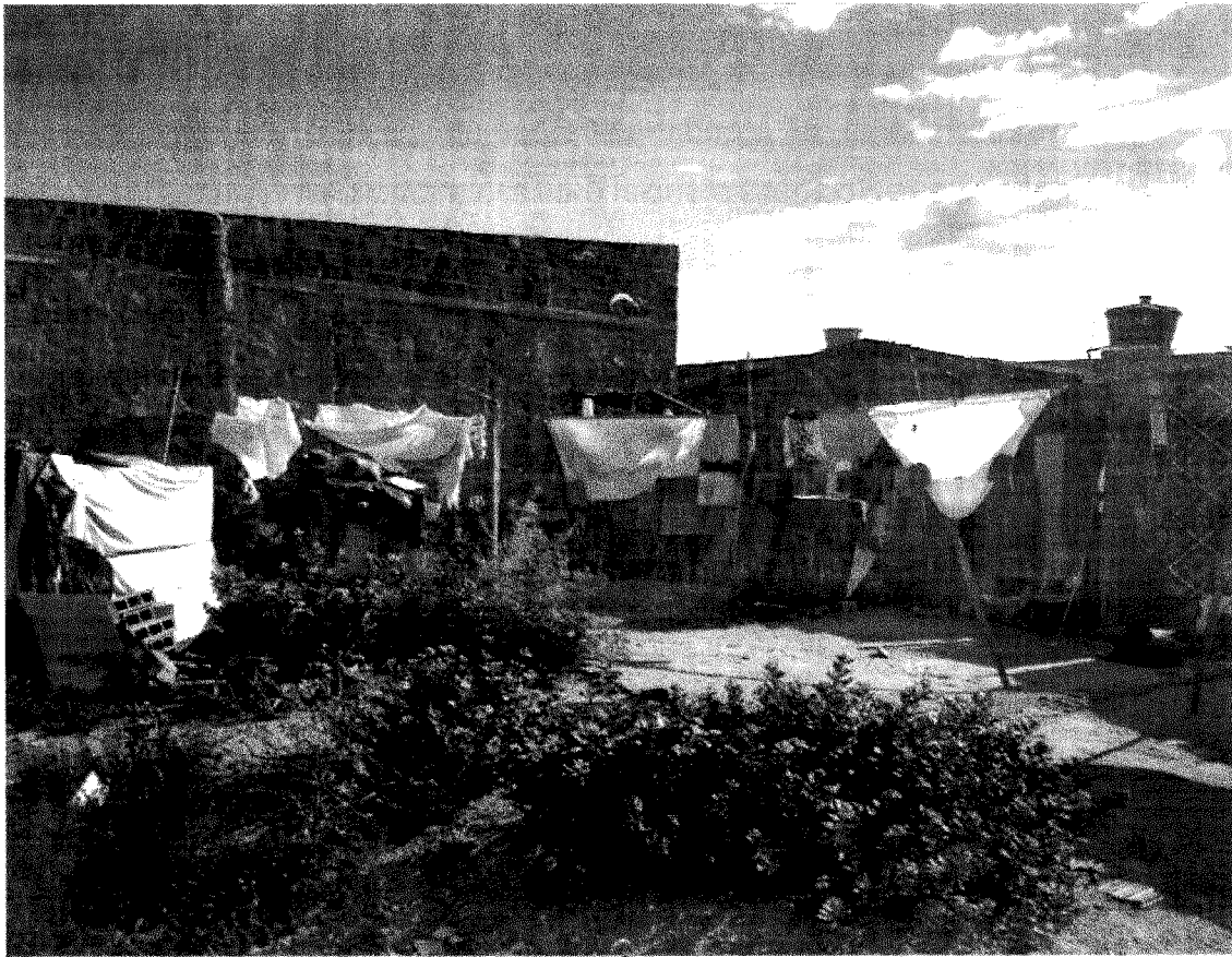
VISITA DOMICILIAR E COMUNITÁRIA NO BAIRRO NOVO MUNDO