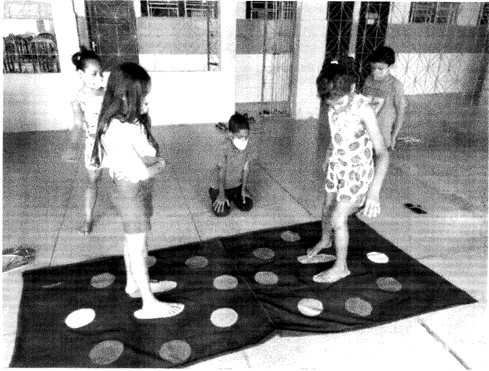
ATIVIDADE DE LAZER DIRIGIDO