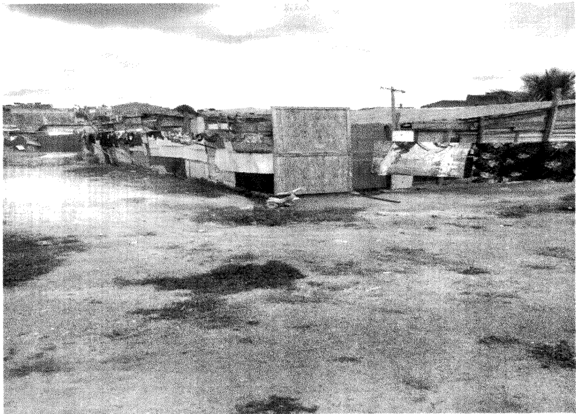
COMUNIDADE VILA DIOCESANA (FAVELINHA)