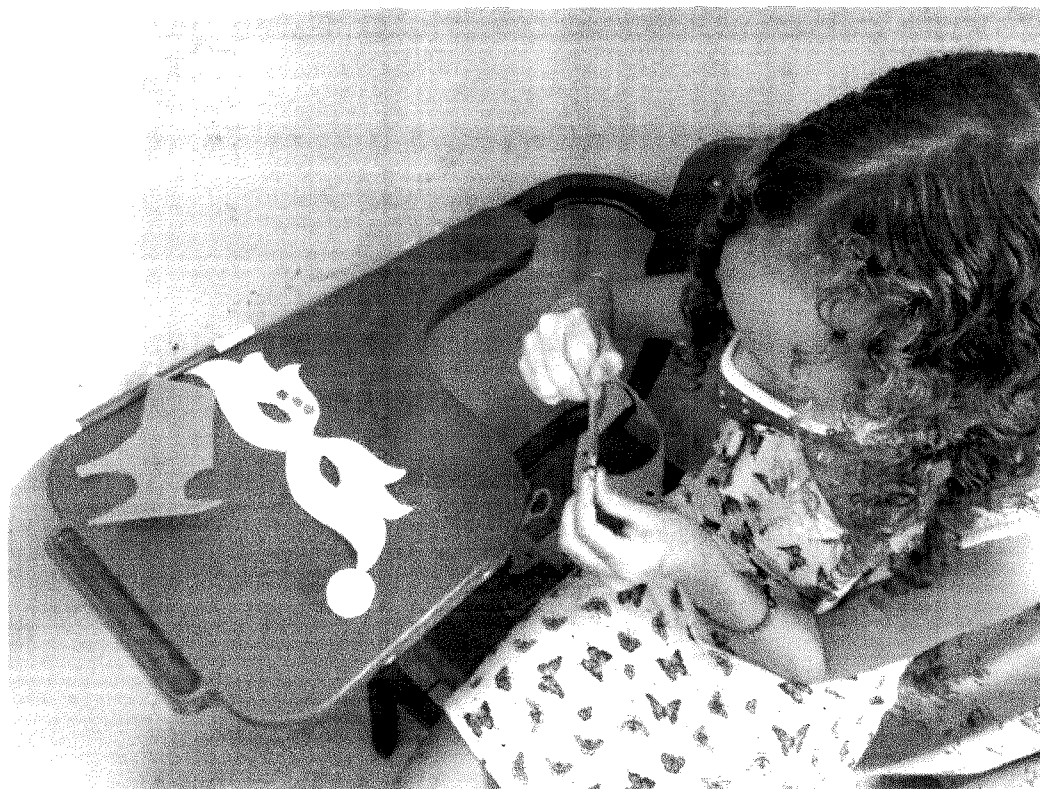
ATIVIDADE DE ARTES SOBRE O CARNAVAL