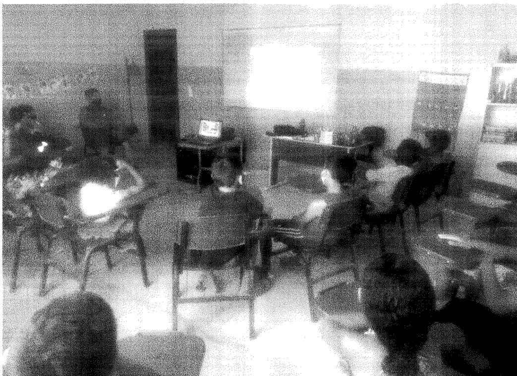
ASSEMBLÉIA DAS CRIANÇAS