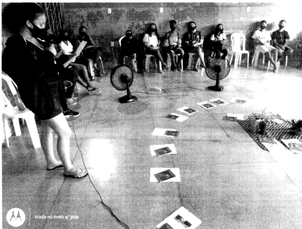
Assembléia dos Educandos e Educandas