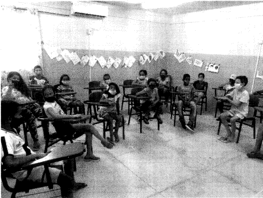
ATIVIDADE DE RODA DE CONVERSA