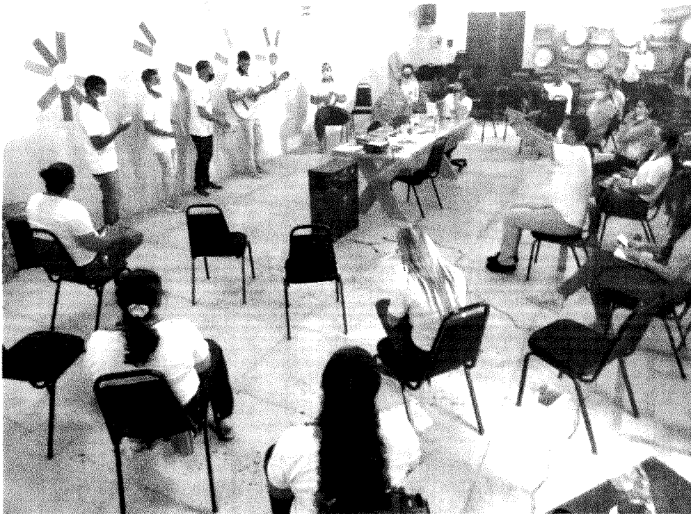
Formação Continuada da Equipe Interdisciplinar