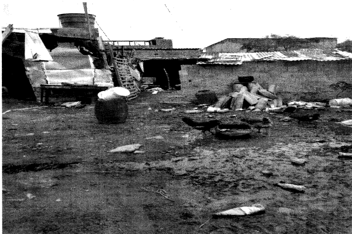
VISITA DOMICILIAR E COMUNITÁRIO NO BAIRRO JOSÉ CARLOS DE OLIVEIRA