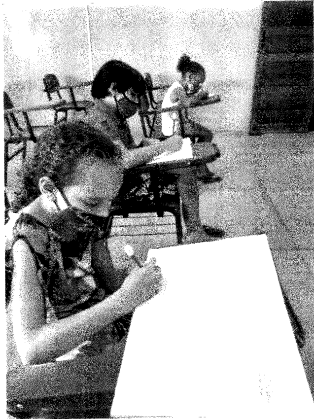
ATIVIDADE DE AUXILIO ESCOLAR